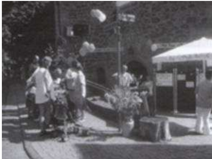
Der Stand des evangelischen Kindergartens „Arche Noah“ am Gederner Gasse Mäart 2003

Wir sind online - besuchen Sie uns im Netz. Modern und informativ präsentieren wir auf unserer Kindergarten-Homepage Informationen vielfältigster Art und berichten von aktuellen Ereignissen rund um den Kindergarten.